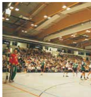
Handball in der VogelsangHalle

Messen und Kongresse finden hier den passenden Rahmen und entsprechende technische und räumliche Voraussetzungen.