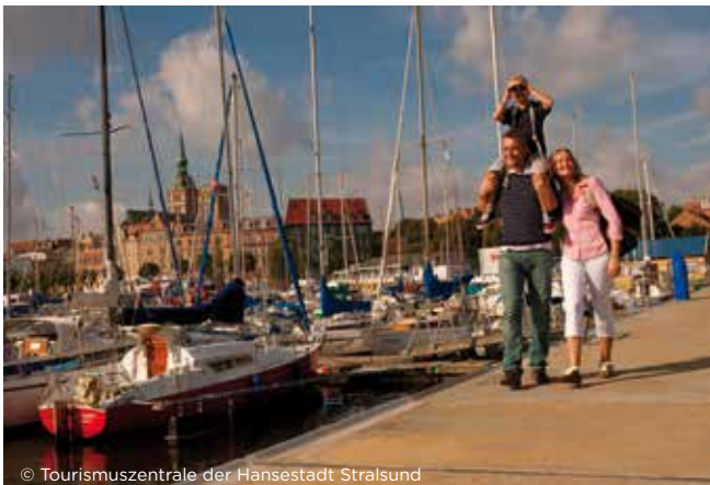
Am Hafen