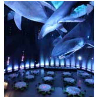
Event im OZEANEUM