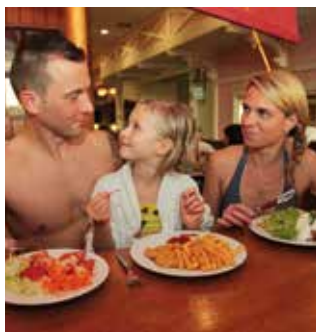
Badehosenrestaurant Käpt´n Nielson