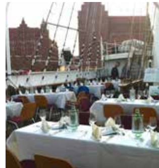
Catering auf der GORCH FOCK 1