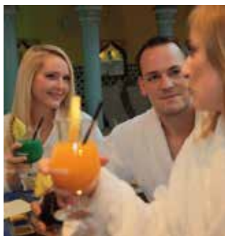
An der Saunabar Marrakech