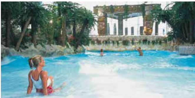
Wellenbecken im Erlebnisbad