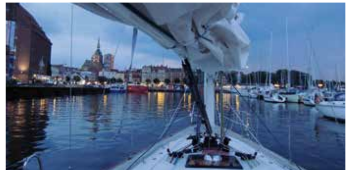
Leinen los - abends im Stralsunder Hafen