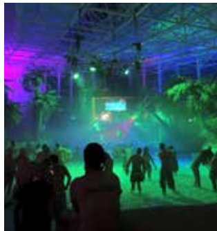
Partynacht im Erlebnisbad