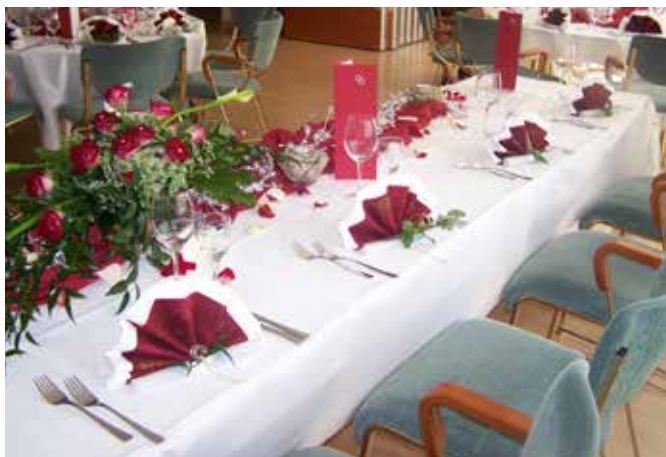
Familienfeierlichkeit im Bankettbereich